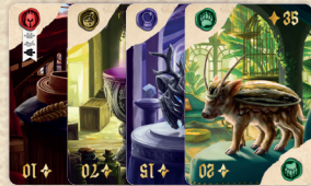
49 Gegenstandskarten unterteilt in 4 Kategorien

Willkommen bei Odd Shop , dem kuriosen Auktionshaus für alle Kuriositäten. Nutze dein eigenes Wissen, um die besten Gegenstände zu erbeuten, oder bezahle eine Fachkraft für ihre Expertise. Aber Vorsicht, nicht alle Gegenstände sind echt!