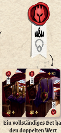
Ein vollständiges Set hat den doppelten Wert

Zur Ausrüstung gibt es ein paar besondere Regeln. Jeder Ausrüstungsgegenstand gehört zu einem Zweier- oder Dreier-Set. Die Symbole auf dem Banner geben an, welche Gegenstände zusammengehören. Besitzt du alle Karten eines Sets, verdoppelt das den Gesamtwert des Sets. Dabei ist egal, ob die Gegenstände echt oder gefälscht sind.